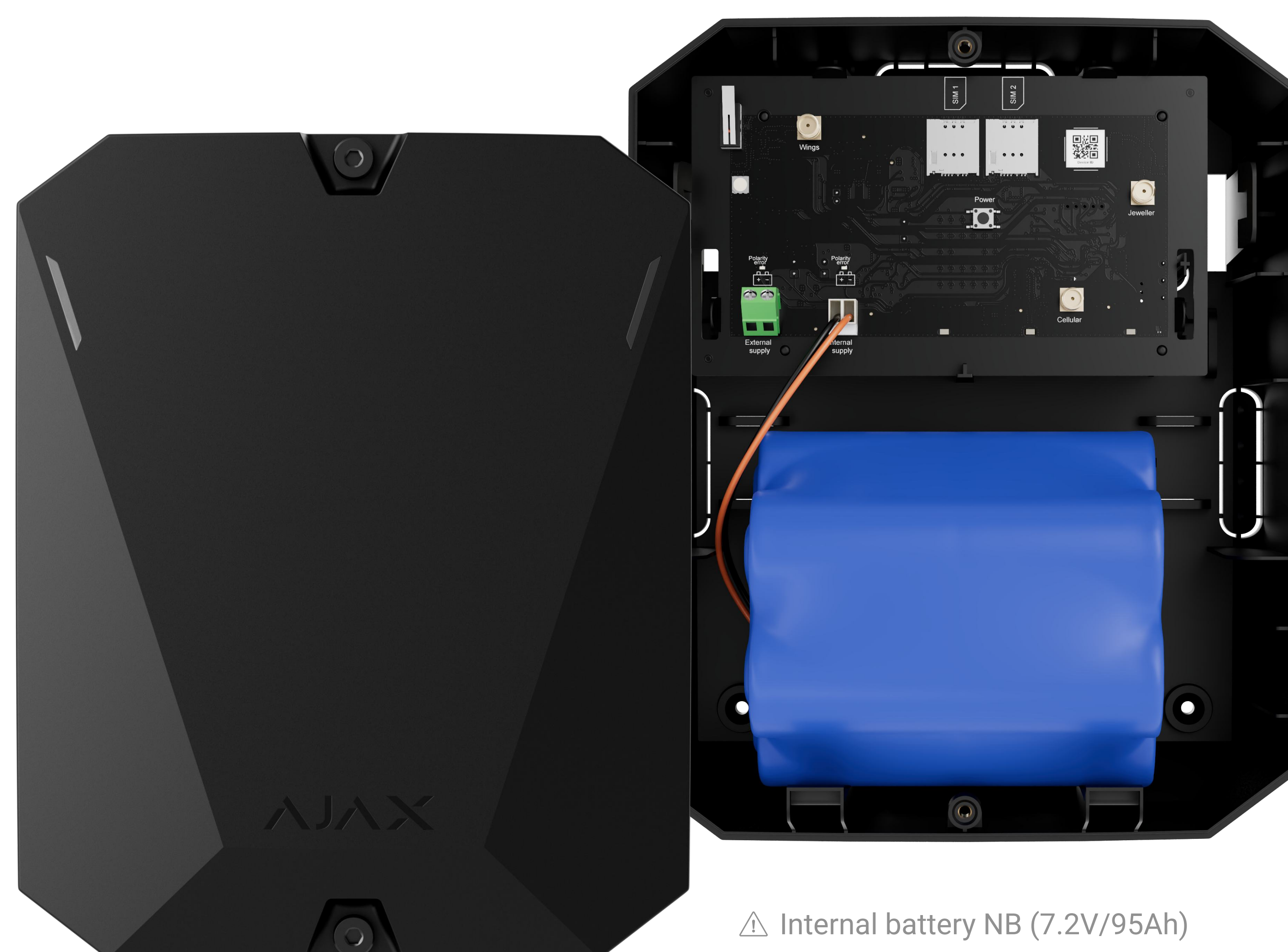
⚠ Internal battery NB (7.2V/95Ah)

Panneau de contrôle sans fil alimenté par batterie. Prend en charge la vérification photo. Connectable via deux cartes SIM (2G/3G/LTE).